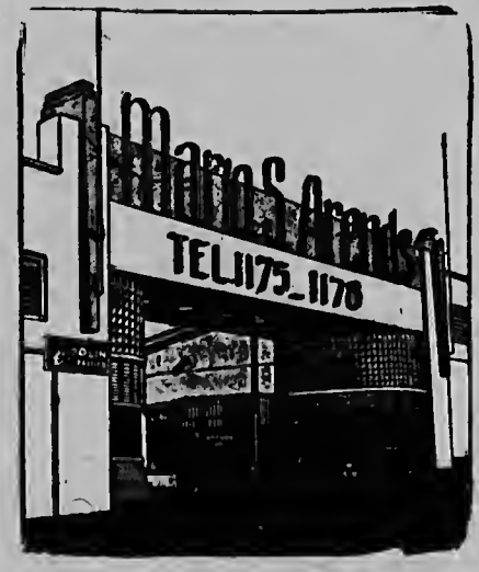
TUR SORTO DI VERF

Pa yuda e club cu lo bai den direccion priva cu un capital pa traha lo nan duna dos cien accion di 50.— florin cada uno cu e habitantenan di Lago Heights por worde compra. E directiva di e club priva probablemente lo worde nombra tan pronto posibel. Generalmente ta worde spera cu despues di e traspaso e activadnan di e club lo crece mas y ya nos a worde informa cu despues di e traspaso lo ta posibel cu lo por duna credit aunque riba un base nobo y te na un cierto suma.